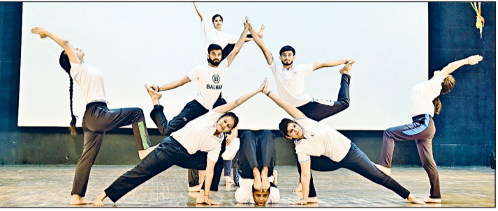
रोहतक। अपनी प्रस्तुति देते प्रतिभागी।

टैलेट सर्च कार्यक्रम सराहना और प्रेरणा के संदेश के साथ संपन्न हुआ, विवि सृजनात्मकता, सांस्कृतिक अमिव्यक्ति और छात्रों के समग्र विकास को निरंतर प्रोत्साहित करता है