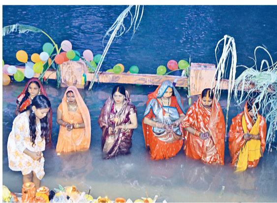
रोहतक। सरोवर के घाटों पर श्रद्धालु।