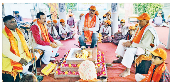
रोहतक। हवन यज्ञ में आहुति डालते आर्यसमाजी।

यह आयोजन भारतीय फैशन के मूल सिद्धांतों और आधुनिक दृष्टिकोण का सुंदर मिश्रण प्रस्तुत करता है। प्रदर्शनी में छात्रों ने पहचान, संस्कृति और सौंदर्यशास्त्र की व्यक्तिगत व्याख्याओं को अपने डिजाइन और प्रस्तुति के माध्यम से व्यक्त किया। उन्होंने गूड बॉय, विषयगत परिधान और अवधारणा-आधारित स्टाइलिंग प्रोजेक्ट्स के जरिए बताया कि किस तरह उभरते डिजाइनर भारत के फैशन परिदृश्य को एक नई दिशा दे रहे हैं। प्रदर्शनी में शोध, रचनात्मक अन्वेषण और वास्तविक फैशन संवेदनशीलता का सुंदर समावेश दिखाई दिया। यह प्रदर्शनी फैशन स्टाइलिंग मॉड्यूल के पांच दिवसीय प्रशिक्षण सत्र का समापन थी, जिसमें छात्रों ने फैशन की नई अवधारणाओं को आधुनिक नजरिए के साथ प्रस्तुत किया। जिसमें छात्रों ने फैशन की नई अवधारणाओं को आधुनिक नजरिए के साथ प्रस्तुत किया।