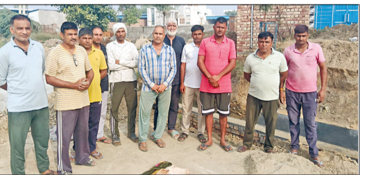
महम। दिल्ली हिसार रोड पर खरकड़ा में निर्माणाधीन नाला। काम पूरा होने से पहले ही गिर चुकी नाले की दीवार ( इनसेट में ) और एकजुट हुए ग्रामीण।

खरकड़ा गांव में दिल्ली हिसार राष्ट्रीय राजमार्ग के साथ साथ गांव के गंदे पानी की निकासी के लिए नाला बनाया जा रहा है। ग्रामीणों का आरोप है इस नाला बनाने में घटिया निर्माण सामग्री का प्रयोग किया जा रहा है। नाला अभी बनकर तैयार भी नहीं हुआ है, उससे पहले ही नाले की दीवार गिर गई है। पुलिस का निर्माण न किए जाने से लोगों को आवागमन में परेशानी हो रही है।