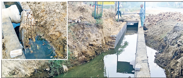
महम। दिल्ली हिसार रोड पर खरकड़ा में निर्माणाधीन नाला। काम पूरा होने से पहले ही गिर चुकी नाले की दीवार ( इनसेट में ) और एकजुट हुए ग्रामीण।